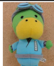
泳力認定マスコット「にんてー君」